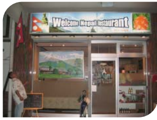
名鉄土橋駅のすぐ目の前!!

お店のホームページには全メニュー掲載。 http://www.welcome-nepal1.com 豊田市土橋町8-18旭ビル106号 TEL(0565)24-2244 AM11:00 ~ PM2:30 PM5:00 ~ 11:00 定休日 第1・第3火曜日