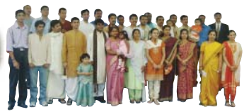
各地方の衣装を着た出演者の皆さん