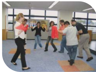
参加者と一緒にフォークダンス