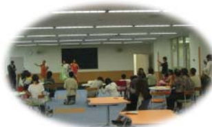
インドのお話を聞く参加者の皆さん