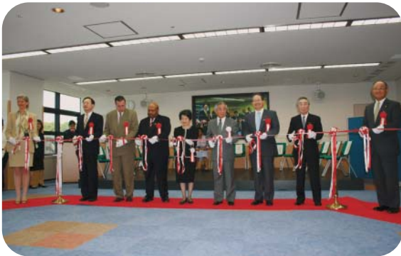
式典:テープカット