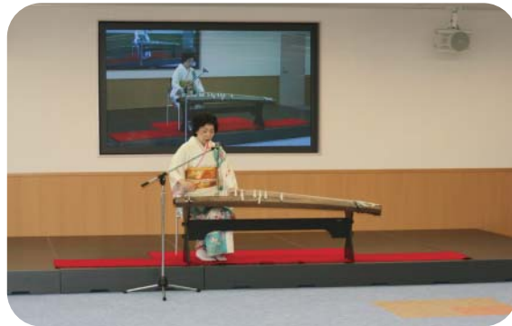
式典(交流会):琴の演奏