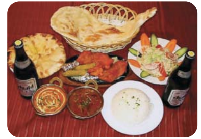
超豪華!!ロイヤルセット(4500円) お二人でいかが?

ドリンクには、ネパールのエベレストビールやインドのビール、ククリラムといった、珍しいお酒もありますので、カレーやモチ(ネ