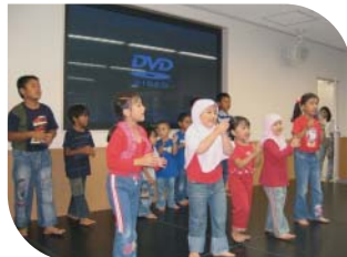
子供たちがかわいらしい踊りを披露