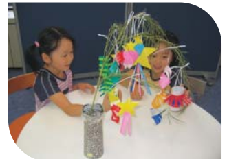
七夕飾りや短冊に願いを込めて