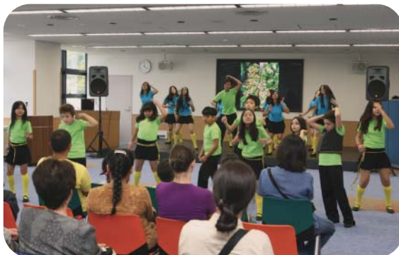
イベント:ブラジルのダンス