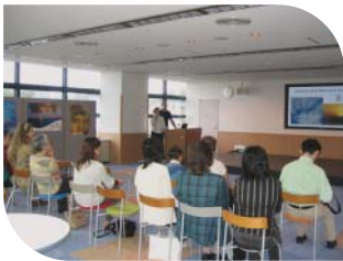
トルコの文化・生活・食事を紹介