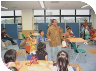
クイズに大盛り上がり