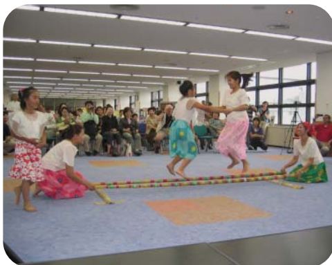
イベント:フィリピンのバンブーダンス

一般公開として行われた記念イベントでは、「これからのグローバルイゼーションと福祉」と題した愛知みずほ大学長の講演会(2日)や「スポーツを通じた国際交流」についての室伏由佳さんのトークショー(3日)を始めとして、抽選会、コンサート、舞踊、英語サロン、ワークショップ、パザー、パネル展示などを実施し、延べ約2,000人に参加いただきました。