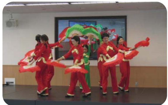
イベント:中国踊り