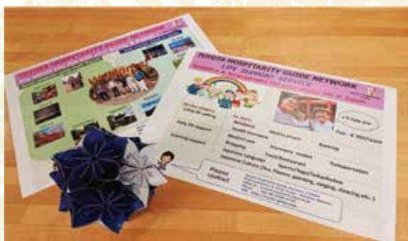
豊田外国人おもてなしガイドネットワーク