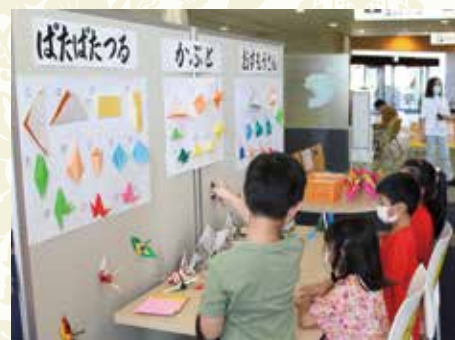
日本文化紹介グループ