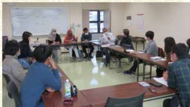
英語ボランティアGLOBE