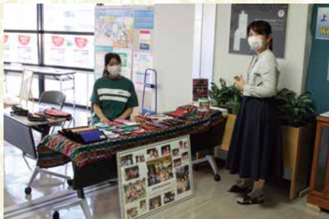
Child Needs Home