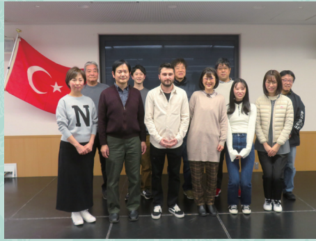
英語ボランティア GLOBE