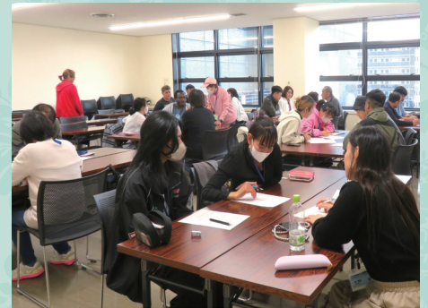
にほんごドット J P