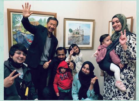
豊田外国人おもてなしガイドネットワーク