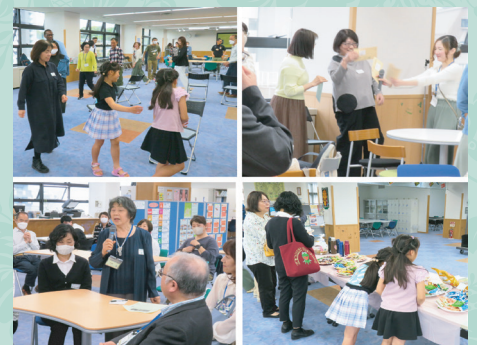
ボランティア総会