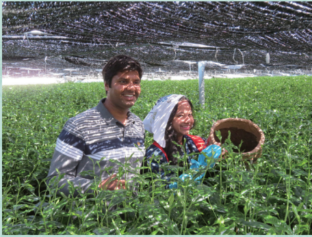
E - I F F

全 11 のグループがそれぞれの活動を行いながら、国際の日などの TIA の事業にも積極的に協力をいただきました。