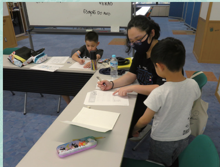
Sementinha de Alfabetização