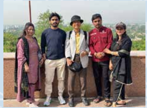
豊田外国人おもてなしガイドネットワーク