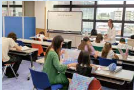
Sementinha de Alfabetização