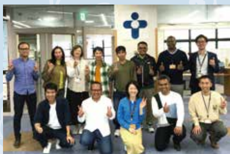
とよた国際市民ネットワーク (TIN)