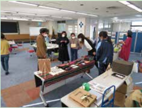
Child Needs Home