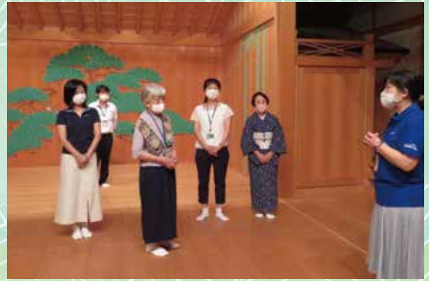
E - I F F