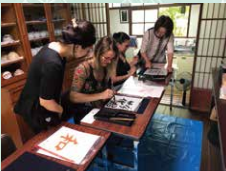
日本文化介绍小组