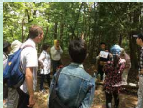
丰田接待外国人 OMOTENASHI 向导联盟