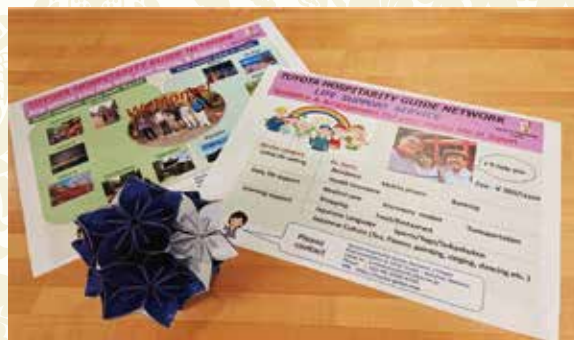
Toyota Gaikoku Omotenashi Guide Net