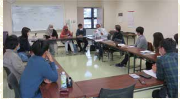
Voluntários da língua inglesa – Globe