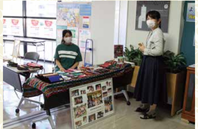
Crianças necessitam de um Lar