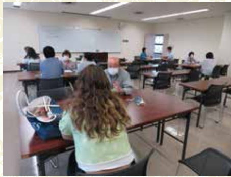
Nihongo Dotto JP