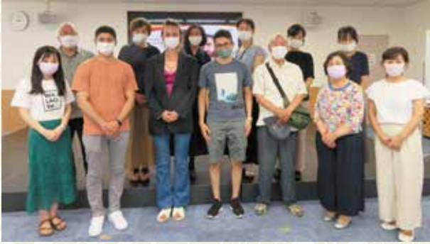
E - I F F

Apesar das restrições às suas atividades devido ao impacto do coronavírus, 11 grupos promoveram suas atividades enquanto tomavam medidas para prevenir a propagação da infecção, e também cooperaram com os projetos da TIA.