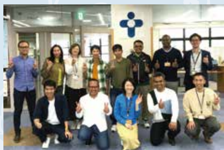
丰田国际市民联盟 (TIN)