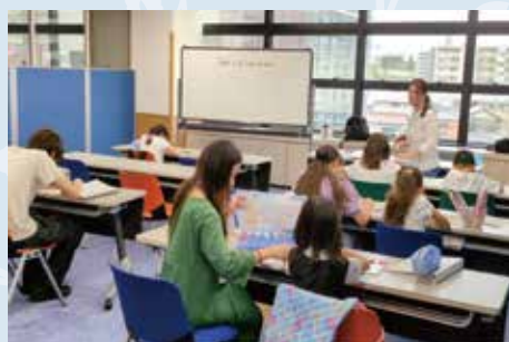
巴西儿童语言教学班