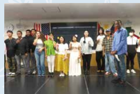
外国青年补习班 托尔西达