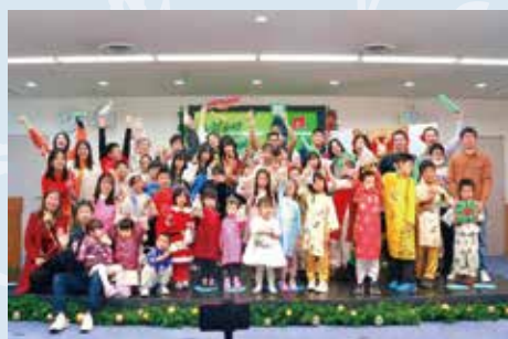
越南儿童语言教学班