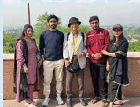
丰田接待外宾导游团体