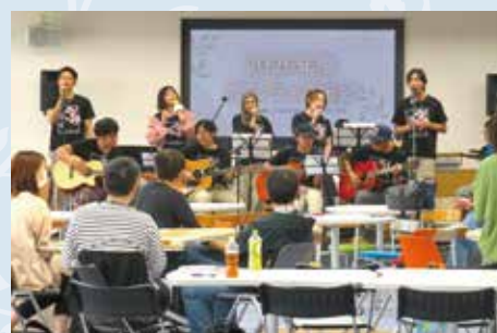
Assembleia Geral de Voluntários