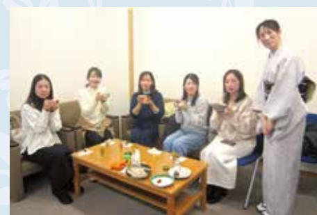
Grupo de Apreciação da Cultura Japonesa