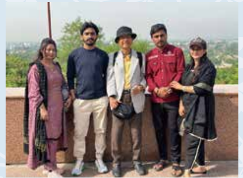
Rede de Guias de Hospitalidade para Estrangeiros de Toyota