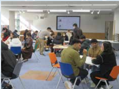
Aulas de Japonês Alpha