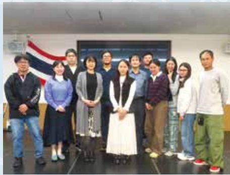
Voluntários de Língua Inglesa - GLOBE