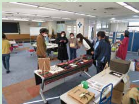
Crianças necessitam de um Lar