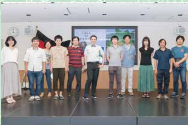
Voluntários da língua inglesa – Globe

Muitas atividades foram restritas por causa do coronavírus, porém com a ajuda dos 11 grupos de voluntários pudemos realizar atividades originais de cada grupo no campo de intercâmbio internacional, compreensão internacional e simbiose multicultural.