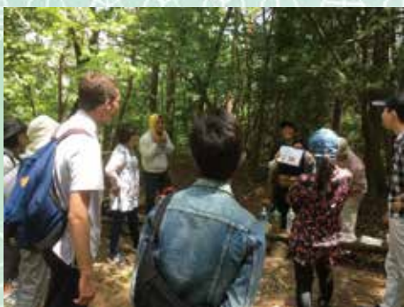
Toyota Gaikoku Omotenashi Guide Net