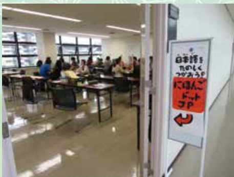
Nihongo Dotto JP